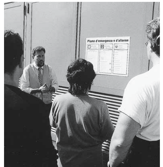
Figura 3: l'istruzione dei collaboratori è compito dei superiori.