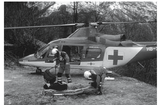
Figura 4: in caso di soccorso aereo definire le coordinate.

Per ulteriori informazioni: - Tessera per i casi di emergenza (codice Suva 88217/1.i) - Materiale di pronto soccorso per le aziende assicurate alla Suva: www.suva.ch/primosoccorso per tutti: www.sapros.ch/aziende/primosoccorso